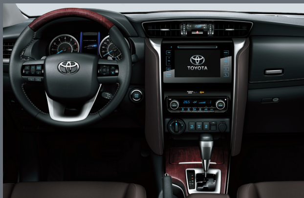
Современный и комфортный интерьер

Победитель в номинации «Среднеразмерный внедорожник» Большого жюри (народного голосования читателей).