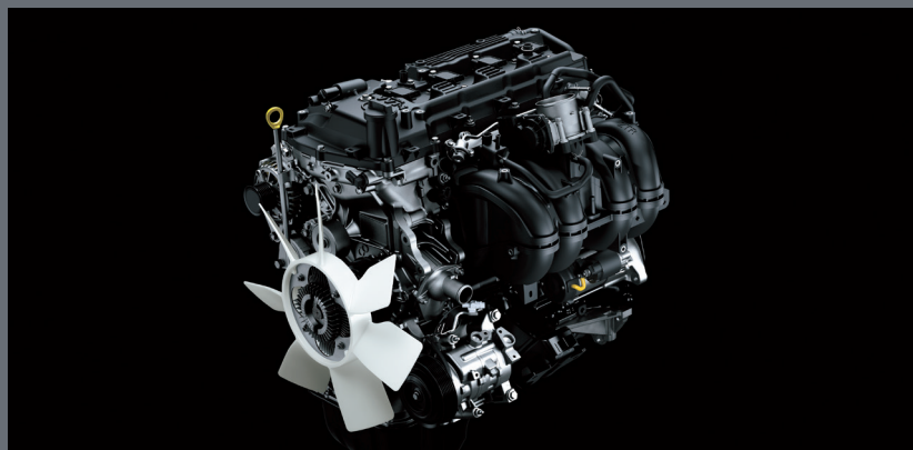
Современный бензиновый или дизельный двигателя