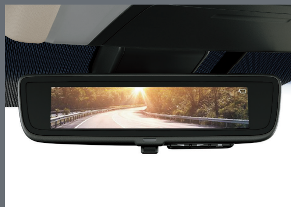
Цифровое зеркало заднего вида

Представленные фотографии и спецификации могут отличаться по комплектации от программы продаж ООО «Тойота Мотор» на территории РФ и Республики Беларусь. Подробную информацию Вы можете получить у Вашего менеджера дилерского центра Тойота.