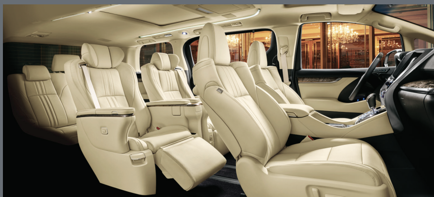
Комфортный семиместный салон